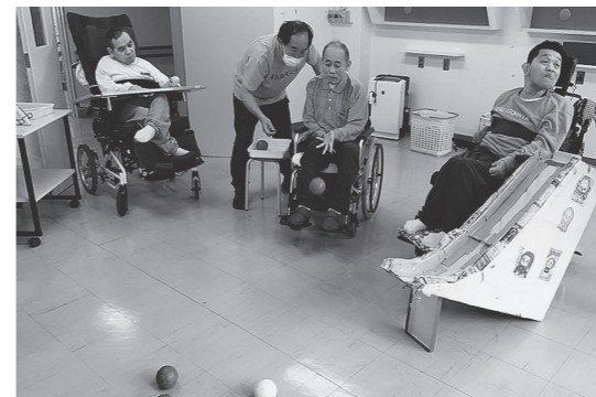
スポーツレクリエーション